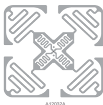
产品设计图 Product design